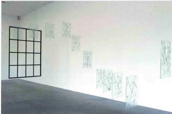
Spiral of Violence , 2005./Cortesía del artista, Kurimanzutto, México, DF y Tate Modern, Londres./ Foto: Andrew Dunkley y Marcus Leith.

Mientras ultimaba detalles para su actual exposición en Tate Modern ( Momento de incertidumbre , abril-junio 2005), Damián Ortega sostuvo este diálogo con otro de los artistas claves de su generación, Abraham Cruzvillegas.