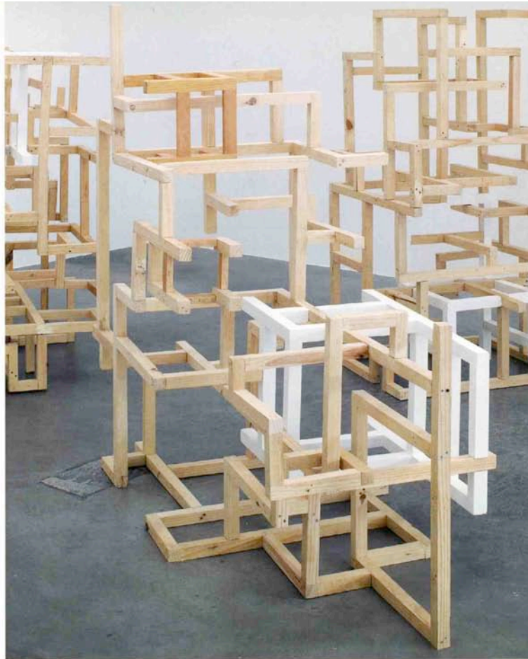
3 Stones/Constructive Failure, 2005./Cortesía del artista, Kurimanzutto, México, DF y Tate Modern, Londres./Foto: Andrew Dunkley y Marcus Leith.

Dan Graham, Detumescence . Tomado de Rock my Religion. Writings and Art Projects 1965-1990 . Dan Graham, editado por Brian Wallis. The MIT Press, Massachusetts, 1993.