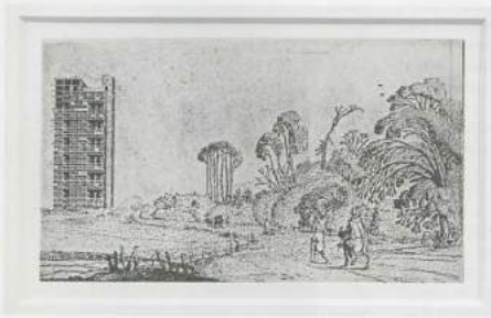
CYPRIN GAILLARD, RELIEF IN THE AGE OF DISBELIEF: HARLEM, 2003, Höhe: 3 1/2 x 6" / GLAURE IN ZEITEN DES UNGLAUBENS: HARLEM, Radierung, 8,5 x 15 cm.