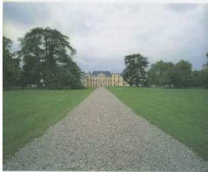
CYPRIEN GAILLARD, LA GRANDE ALLÉE DU CHÂTEAU D'OIRON (THE GRAND ALLEY OF CHÂTEAU D'OIRON), 2008, recycled concrete, installation view / DIE GROSSE ALLEE VON SCHLOSS OIRON, recycelter Beton, Installationsansicht.

Was so schlecht gebaut wurde, muss schneller zerstört werden. —Guy Debord, 1994 1)