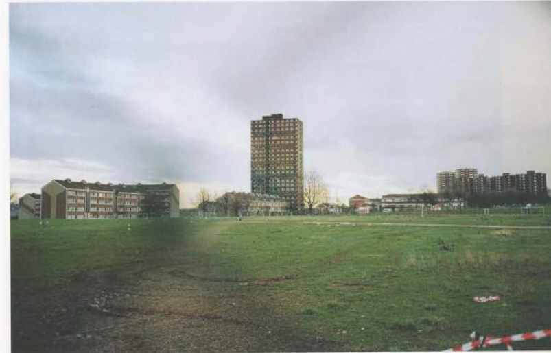
CYPRIEN GAILLARD, COLOR LIKE NO OTHER, 2007, film still, video, 2 min 58 sec / FARBE WIE KEINE ANDERE, Filmstill, Video, 2 Min. 58 Sek.

von Architektur zum Thema: In einem kurzen, betörend schönen Ausschnitt von CITIES OF GOLD AND MIRRORS (Städte aus Gold und Spiegeln, 2009) erzittert die verspiegelte Fassade eines gleich zusammensackenden Bürohauses in Erwartung des unmittelbar bevorstehenden Einsturzes; aus dem recycelten Beton solcher Ereignisse entstehen skulpturale Interventionen wie LA GRANDE ALLÉE DU CHÂTEAU D'OIRON (Die große Allee des Château d'Oiron) oder CENOTAPH TO 12 RIVERFORD ROAD, POLLOKSHAWS, GLASGOW, 2008 (Kenotaph für die Riverford Road Nr. 12, Pollokshaws, Glasgow 2008, beide 2008); und