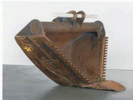
CYPRIEN GAILLARD, KING ISLAND STURTTAIL, 2013, excavator head, white vinyl, 92 x 123 x 77" / Baggerisffel, unisex Onyx, 241,3 x 312,4 x 195,6 cm.