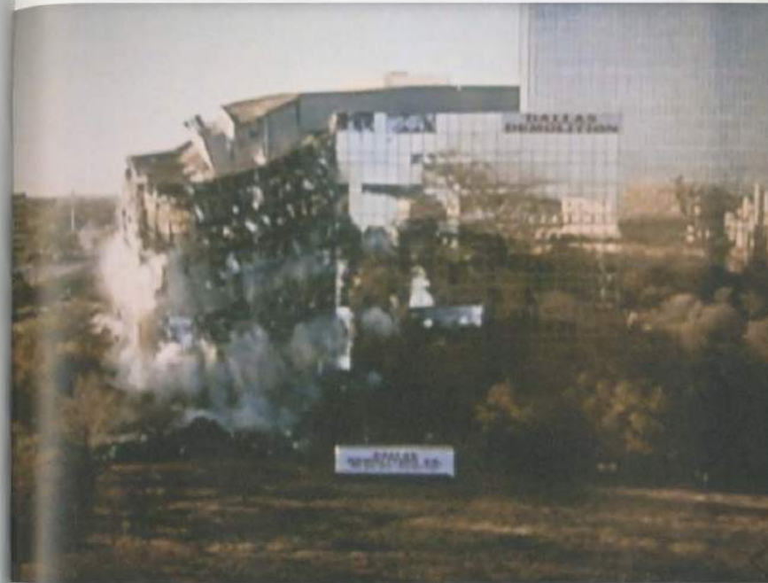
CYPRIEN GAILLARD, CITIES OF GOLD AND MIRRORS , 2009, film still, 16 mm film, color, sound, 8 min, 52 sec / STÄDTE AUS GOLD UND SPIEGELN , Filmstill, 16-mm-Film, Farbe, Ton, 8 Min., 52 Sek.