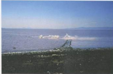
CYPRÏEN GAILLARD, REAL REMNANTS OF FICTIVE WARS VI, 2007, 35 mm film transferred to DVD, 1 min 40 sec / ECHTE ÜBERRESTE FIKTIVER KRIEGE, 35-mm-Film übertragen auf DVD, 1 Min. 40 Sek.

bole der Unterdrückung, Vertreibung und des kulturellen Verfalls zusammen.