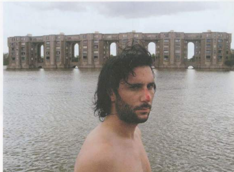
CYPRIEN GAILLARD, THE LAKE ARCHES, 2007, video, 1 min 39 sec / DER SEE ARCHES, Video, 1 Min. 39 Sek.

grell Lightshow aufgemachte Zerstörung. Gaillards Werk zeigt die «Jugend als Teil der Landschaft» 2) und die Aktivitäten dieser jungen Leute widerspiegeln den Verfall, der sie umgibt: Alkoholexzesse, Vandalismus und Gewalt.