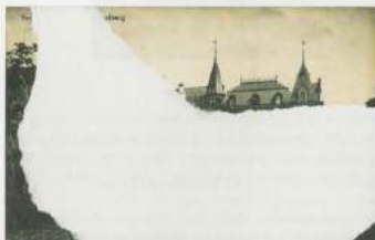
CYPRIEN GAILLARD, NEW PICTURESQUE, 2011, postcard, paper, 3 1/2" x 5 1/2", each / NEU PITTORESK, Postkarte, Papier, je 9 x 13,5 cm