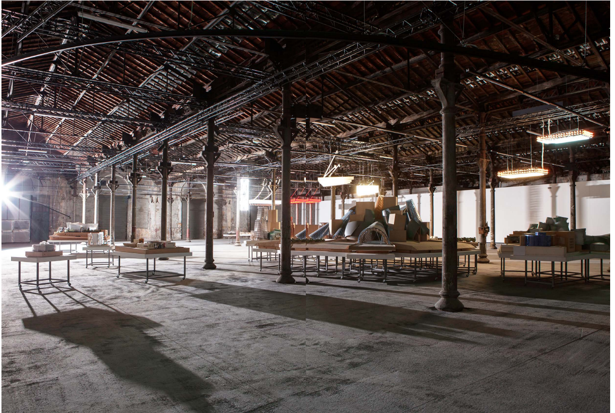
Above and next spread - "Solaris Chronicles" installation views at Luma Foundation, Arles, 2014.