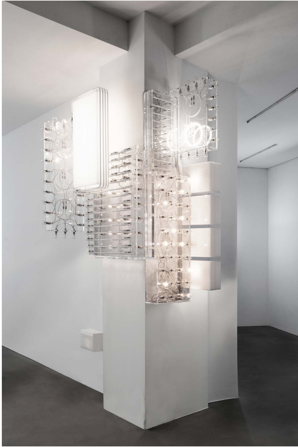
Marquee (cluster) , 2014.

RETHINKING THE RITUAL OF THE EXHIBITION H. U. OBRIST