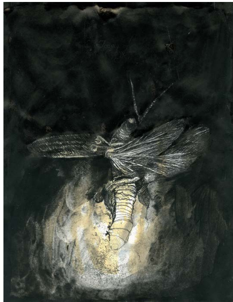
With a Rhythmic Instinction to be Able to Travel Beyond Existing Forces of Life (stills), 2014.