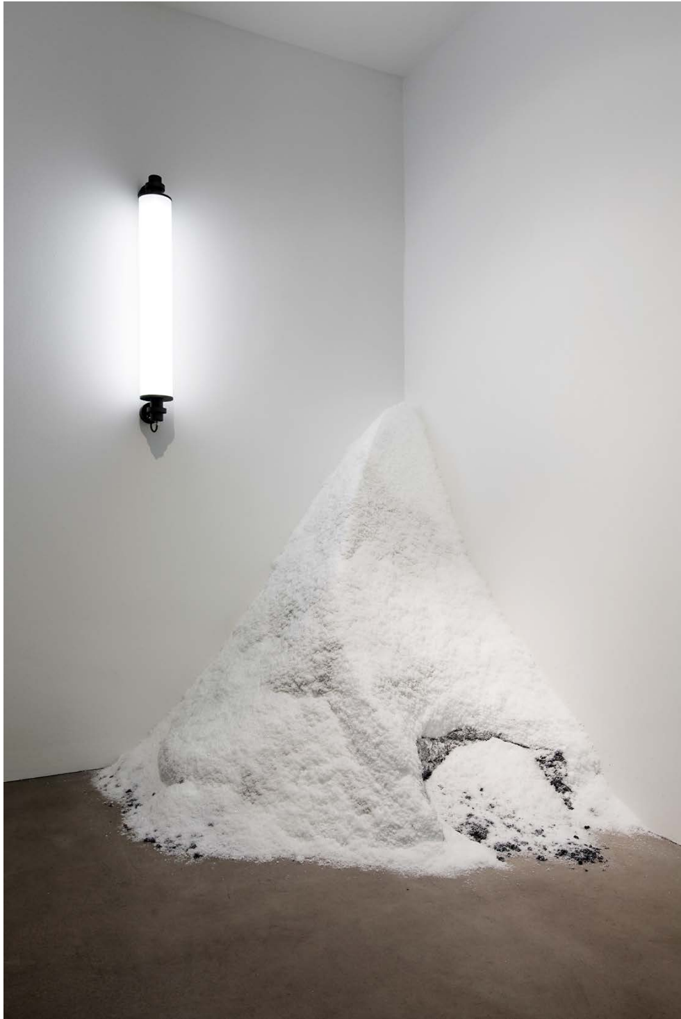
Flickering Light , 2013 and Snow Drift , 2014. Courtesy: the artist and Esther Schipper, Berlin. Photo: Andrea Rossetti