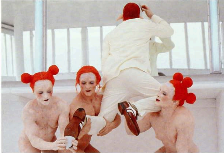
MATTHEW BARNEY, CREMASTER 4, 1994, production still.

ferenz, von Stillstand und Bewegung ist verwandt mit orientalischen Symbol- und Ornamentsprachen und knüpft an die Tradition der komplementären Entsprechungen an.