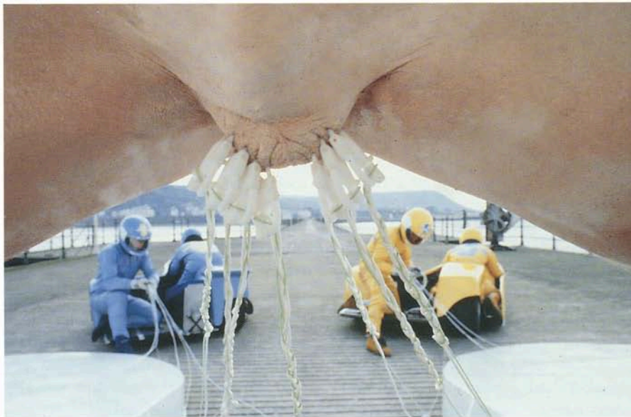
MATTHEW BARNEY, CREMASTER 4, 1994, production still.