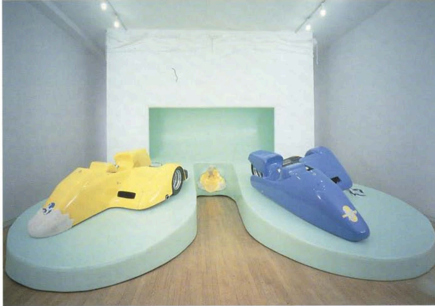
MATTHEW BARNEY, CREMASTER 4: THE ISLE OF MAN , 1994/95, installation view, Barbara Gladstone Gallery, 1995.